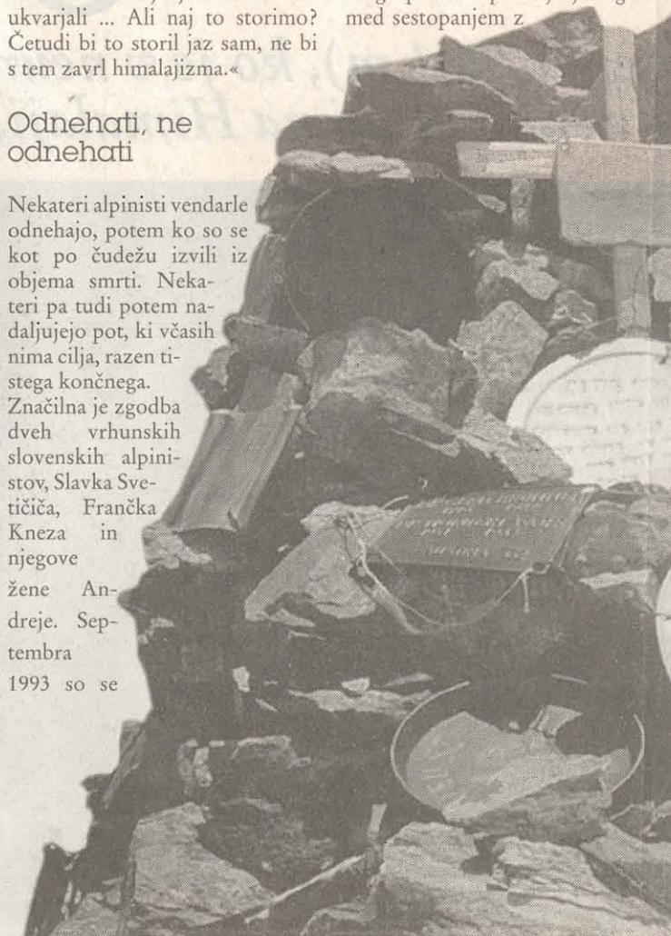
Pokopališče oziroma množični kenotaf žrtev druge najvišje gore