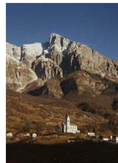
Drežnica - Krn

Karakorum: Gašerbrum IV: poskus prvenstvenega vzpona prek Z stene v alpskem stilu, dosegel 7150 m, med sestopom se je verjetno ponesrečil.