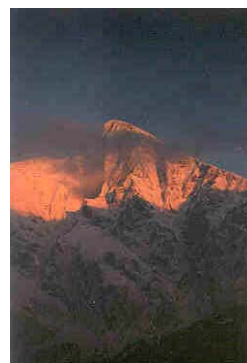
Zahodna Stena Krna

1.7. Novi vrh: Pojoča travica (VI-, 100 m, 30 min) & Levitan (VI+, 100 m, 1 h) & Omama (VII+, 100 m, 30 min)