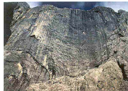
Planja J stena