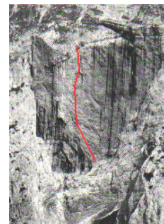
Planja J stena Črni baron